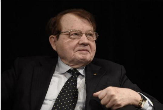
Pr Luc Montagnier 18 août 1932 – 8 février 2022

La Ligue Nationale pour la Liberté des Vaccinations rend hommage au Professeur Luc Montagnier, prix Nobel de médecine 2008, et qui a co-découvert le VIH en 1983, qui s'est éteint paisiblement le 8 février 2022.