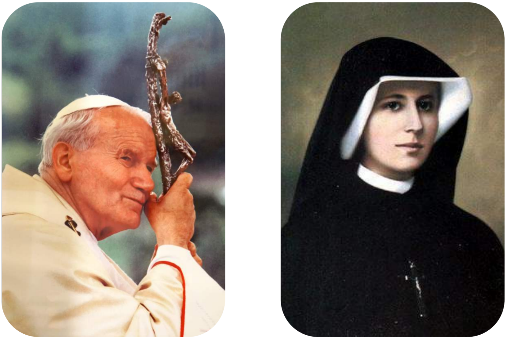
Réciter le chapelet de la Miséricorde

Père Éternel, jetez un regard miséricordieux sur les âmes des hérétiques et des apostats qui, persistant obstinément dans leurs erreurs, gaspillèrent Vos bontés et abusèrent de Vos grâces. Ne regardez pas leurs fautes, mais l’amour de Votre fils et Son amère Passion qu’Il souffrit égale-ment pour elles, puisqu’elles aussi sont enfermées dans le Cœur Très Compatissant de Jésus. Faites qu’elles aussi glorifient Votre immense Miséricorde dans les siècles des siècles. Amen.